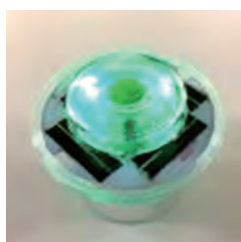
■ カラー: 緑