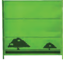
ガードフェンスF-18CG (三段緑板)