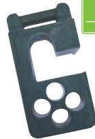
ガードフェンスバリアード 兼用ブロック(鋳物)