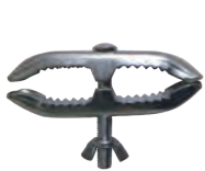
ガードフェンス 止めバンド