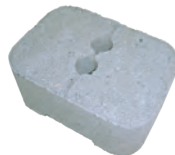
プラフェンス用ブロック(角)