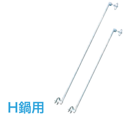
H鋼用 ガードフェンスサポート

■サイズ：1,800mm (1,800ガードフェンス用) 1,200mm (1,200ガードフェンス用)