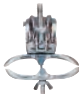
ガードフェンス 止めバンドクランプ付