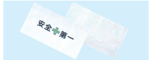
ガードフェンス用 目隠しシート(安全第一)