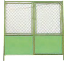
ガードフェンスF-18AGT (扉)