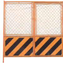
ガードフェンスF-18AT (扉)