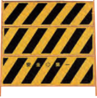
ガードフェンスF-18C (三段トラ板)