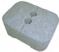
ガードフェンス用 ブロック(角)