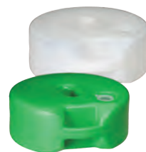
プラフェンス用ブロック(水タンク)