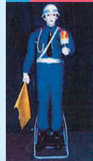
右腕が可動し、左腕の回転灯は固定となります。