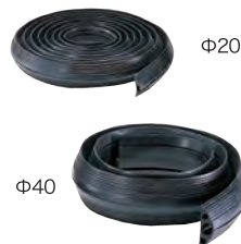
コードプロテクター