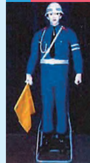
右腕が可動し、左腕は固定となります。