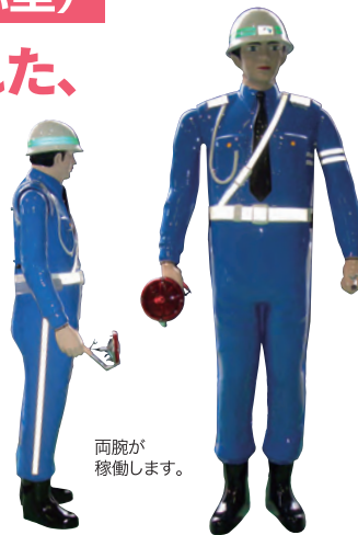
両腕が稼働します。